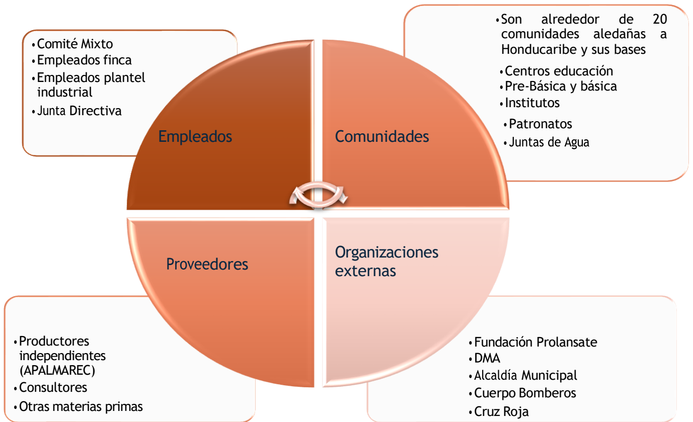
FIGURA 3. IDENTIFICACIÓN DE PARTES INTERESADAS DE HONDUCARIBE Y SUS BASES ASOCIADAS.