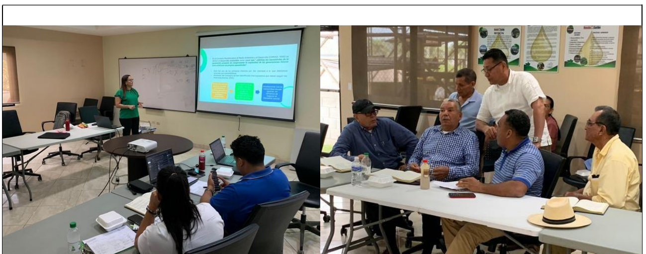
Fotografías de la capacitación a la Junta Directiva

A continuación se muestran fotografías de la capacitación en el tema de “Gestión de la Responsabilidad Social de los Cultivadores de Palma de Aceite” dirigido a los miembros de la Junta Directiva de Honducaribe.