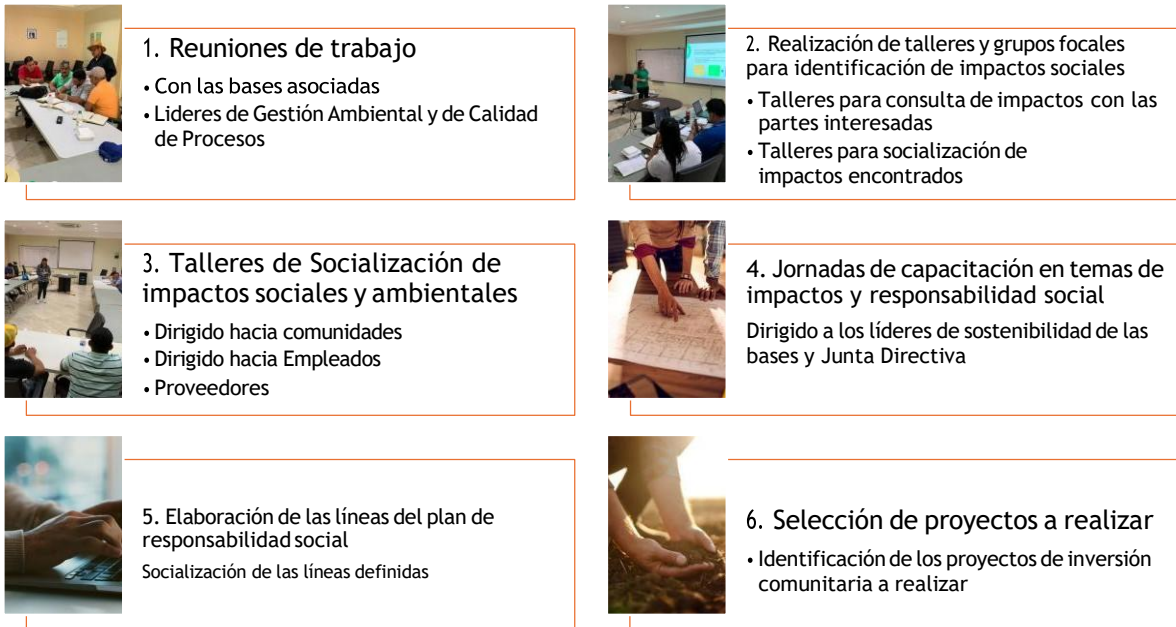
FIGURA 4. DESCRIPCIÓN DEL PROCESO METODOLÓGICO REALIZADO PARA LA ELABORACIÓN DEL PLAN DE RESPONSABILIDAD SOCIAL.

Durante las jornadas de formación, se capacitó a los auditores y personal clave de Honducaribe en los conceptos de EISA y mapeo de actores, así como en la metodología a utilizar en las consultas y la validación de los instrumentos a aplicar